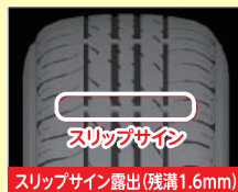
スリップサイン 露出(残溝1.6mm)